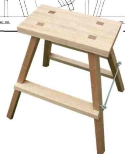
教材：四方転び踏み台